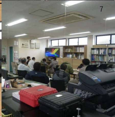
1.POWJapan とパートナー関係の継続 2・3.沿道の清掃 4.ボランティアによる記念碑修繕 5.複合施設 UNE への協力 6.上映会の開催 7.省エネ勉強会の開催